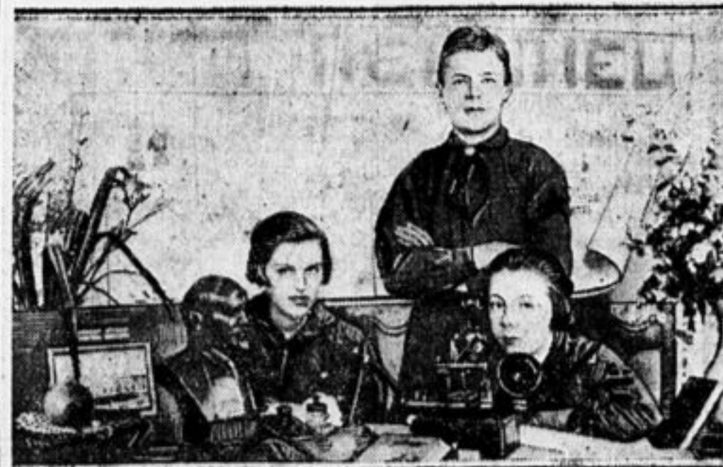
Шведские пионеры в г. Вятке с подарками от ребят и пионеров.