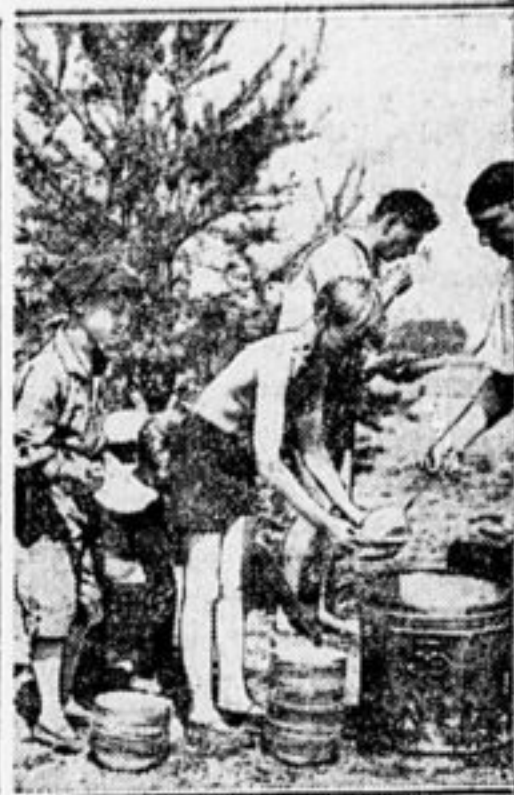
За мытьем посуды.

Из лагеря Ворошилова я возвратился с удесытеренной верой, что победа на нашей стороне — рабочего класса. Из ла-