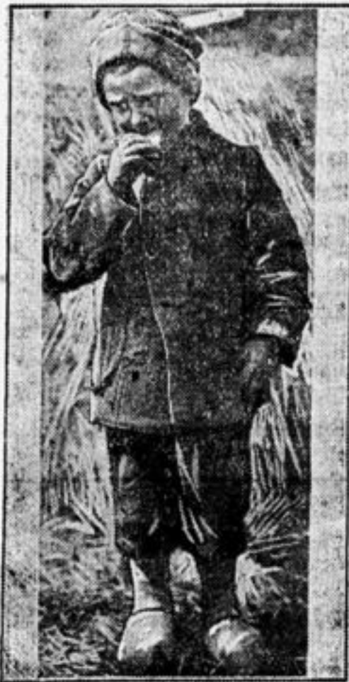
Мальчик из детдома Мопра в Германии.

Дружно возьмемся за продвижение нашей газеты в детскую среду. Районы, будьте застрельщиками культурного дела. Отряды, проявляйте больше самостоятельности, организуйте соревнования между звеньями по сбору подписки. Кто больше?