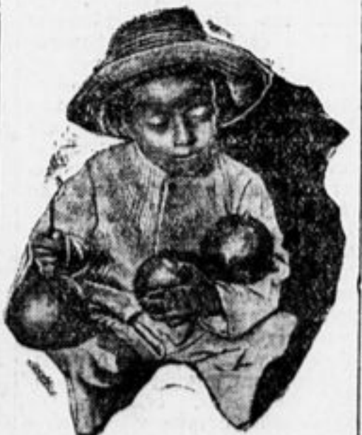
Индийский мальчик из Бразилии.

— Вытяни руки! Держи ладони открытыми! — командовал метр и вслед за этими словами в воздухе раздавался свист линейки