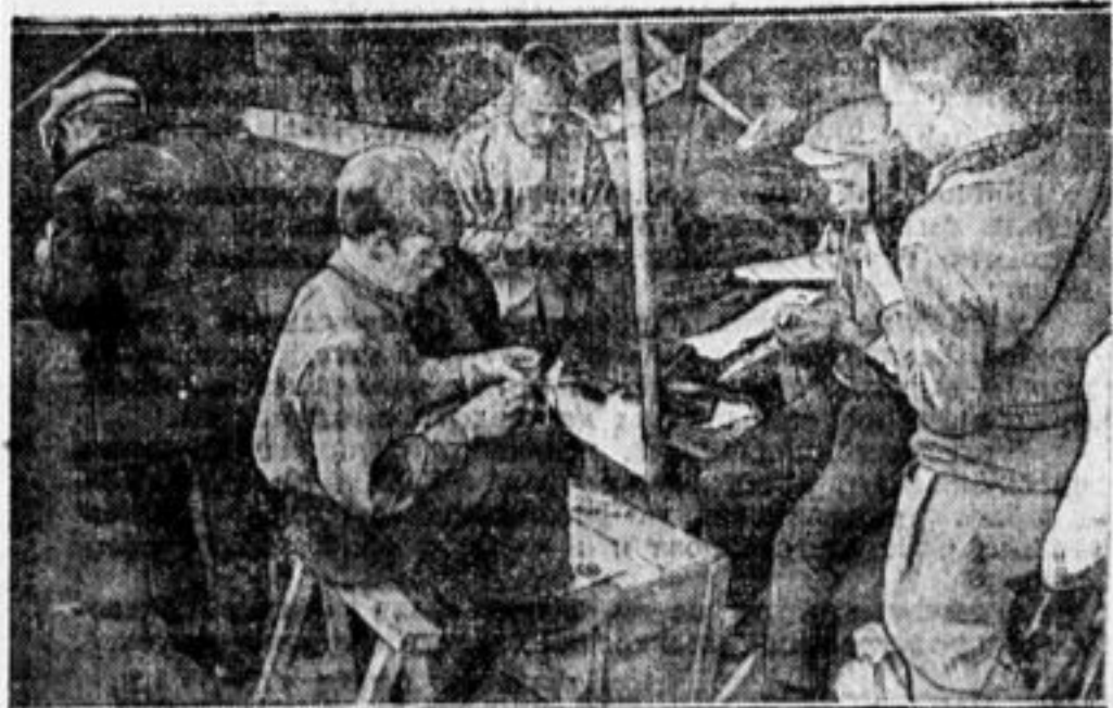
На всесоюзных состязаниях мо делств. За починкой моделей.

Мы узнали из газеты и из жизни нашего отряда, что ребята, исключенные из отряда, становятся хуже. Девчата пудрятся, мажутся. Ребята гоняют голубей, играют в карты, а потому мы за то, чтобы перевоспитывать, а не выгонять из отрядов.